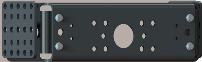
POUR CROCHETS T2682020