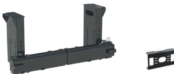
EN OPTION : SUPPORTS PORTE-FEUX