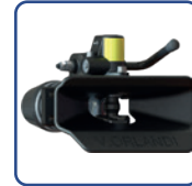
POUR CROCHETS DIN40