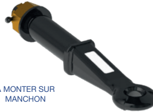
A MONTER SUR MANCHON